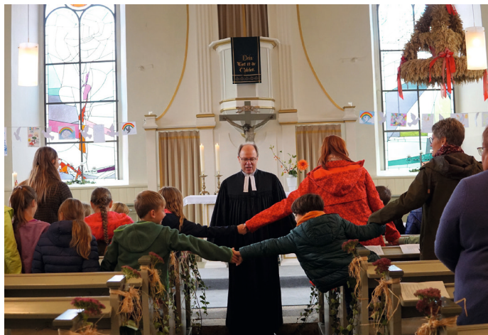
Am Ende des Gottesdienstes ging es mit einem Lachen im Gesicht und Frieden im Herzen in die Herbstferien.

Die Kinder machten sich auch Gedanken darüber, was Frieden genau bedeutet und was ihn ausmacht. Der Pastor