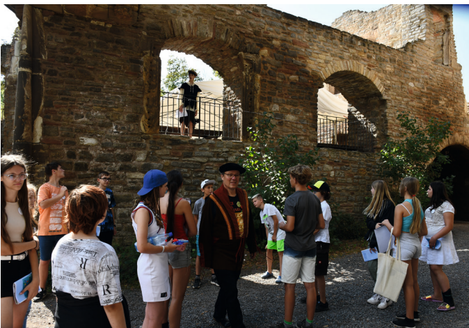
Geländespiel zum Leben Martin Luthers

Am Mittwoch ging es nach Eisleben. Da haben wir Martin Luthers Geburtshaus und die Kirche, in der er getauft wurde,