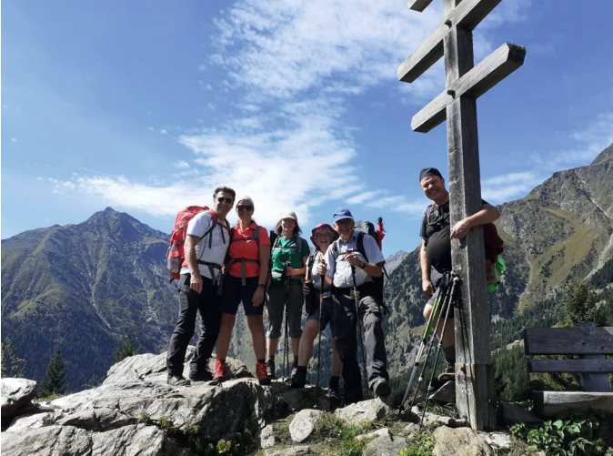
Schöner Ausblick an der „Hochwiege“ (J. Lawes)

Unser Pastor Uwe Rumberg-Schimmelfeng hatte zu einer Pilgerwanderung am Meraner Höhenweg in der Zeit vom 13. bis 18. September 2022 eingeladen.