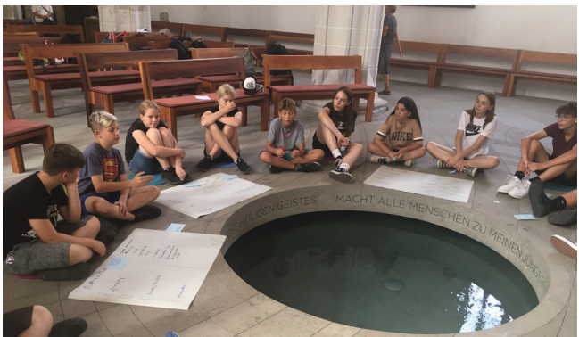
Konfirmanden am Taufbrunnen in Luthers Taufkirche in Eisleben