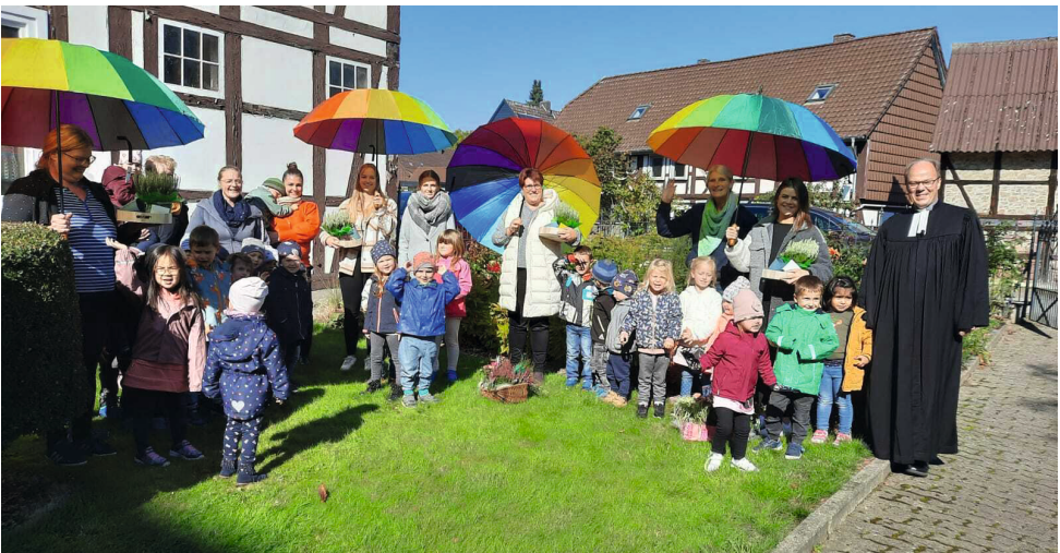
Viele Kinder haben sich von den Erzieherinnen verabschiedet.