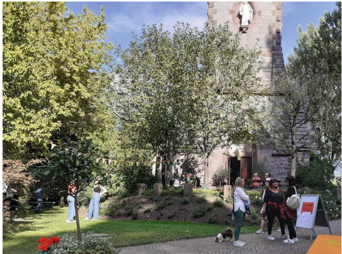
Bei der ev.-luth. Gemeinde in Meran - Christuskirche (J. Lawes)

Am Nachmittag unserer Rückreise sind wir noch auf dem Som-