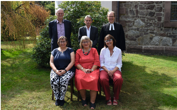
Goldene Konfirmation - Konfirmationsjahrgang 1970