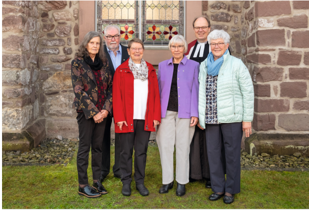
Diamantene Konfirmation - Konfirmationsjahrgang 1961/62