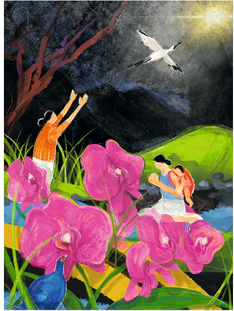
Bild zum Weltgebetstag 2023 mit dem Titel „I Have Heard About Your Faith“ von der taiwanischen Künstlerin Hui-Wen Hsiao.

Die Hauptinsel des 23 Millionen Einwohner*innen zählenden Pazifikstaats ist ungefähr so groß wie Baden-Württemberg. Auf kleiner Fläche wechseln sich schroffe Gebirgszüge, sanfte Ebenen