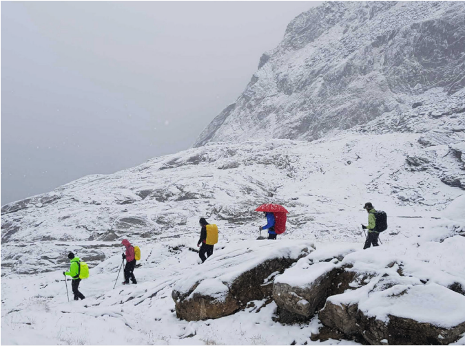
Abstieg von der Stettiner Hütte im Schnee (J. Lawes)

merfest der evangelisch-lutherischen Gemeinde in Meran gelandet und haben die schöne Christuskirche an der Passerpromenade besichtigt. Für Speisen und Getränke war reichlich gesorgt.