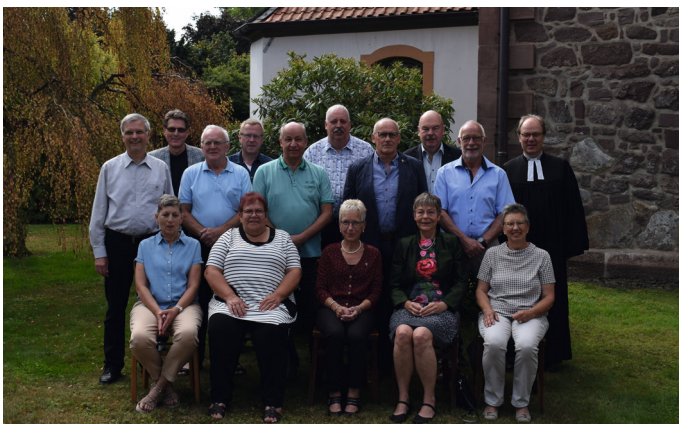
Goldene Konfirmation - Konfirmationsjahrgang 1971