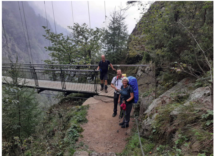
Nach der Überquerung der Hängebücke im Tal der tausend Stufen

Höhepunkte waren das Tal der tausend Stufen mit seiner Hängebücke, die Wanderung durchs Pfossttal bis hinauf zum Eisjöchl, der Abstieg von der Stettiner Hütte im Schnee bei -6^{\circ} C, der Almab-