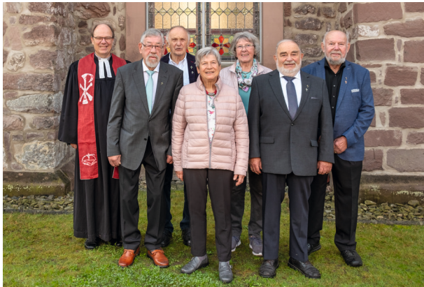
Eiserne Konfirmation - Konfirmationsjahrgang 1956/57