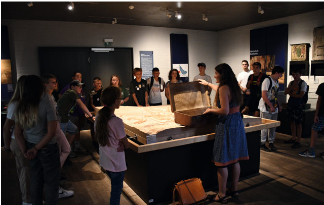
Führung durch Luther's Geburtshaus