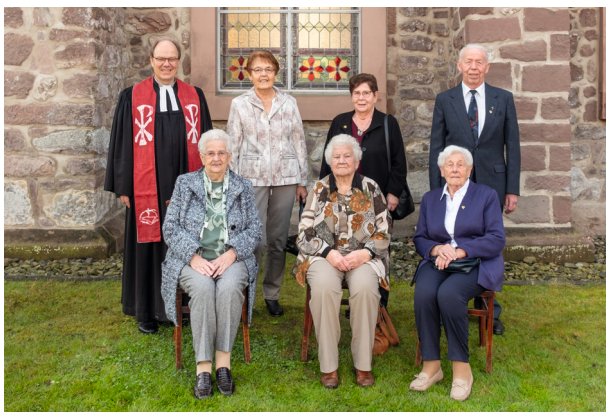
Gnaden-Konfirmation - Konfirmationsjahrgang 1951/52