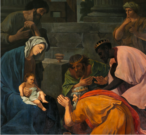
Anbetung des Kindes (Bild in Sint-Salvator Kerk, Harelbeke, West-Vlaanderen. Belgien)

„Die Weisen warfen sich vor dem Kind nieder und beteten es an.“