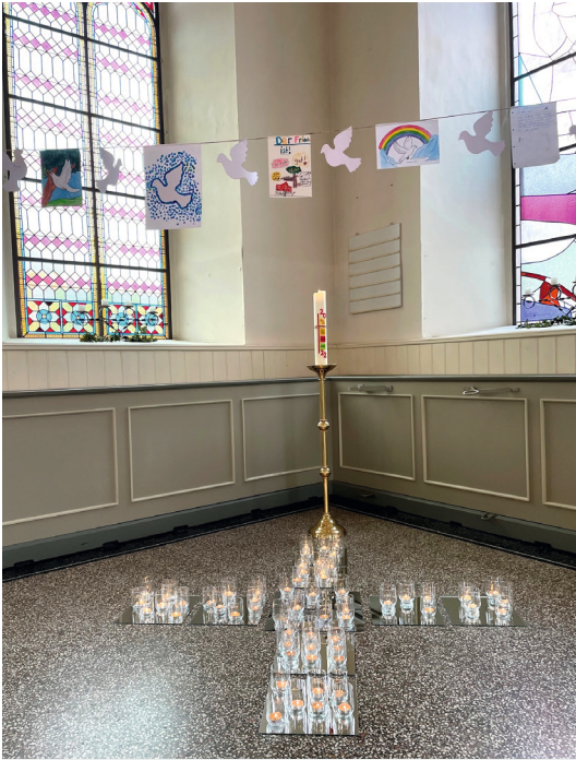
Kirchenschmuck aus gebastelten Friedenstauben, gemalten Regenbögen sowie formulierten Gedanken und Botschaften des Friedens mit dem Kreuz aus Friedenskerzen

las einige Auszüge vor: „Spaß, kein Krieg, Versöhnung, Freude, nach einem Streit wieder vertragen, Glück... Der Frieden ist das Beste! So stelle ich mir Frieden vor: Wie in der Kirche, eine Stille und Ruhe.“