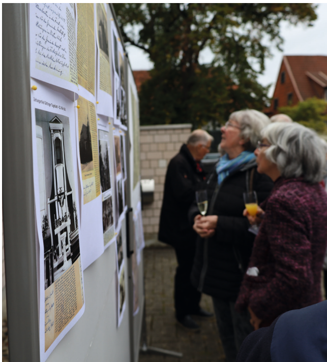
Die Gäste konnten sich anhand von Schautafeln über die Geschichte der Kirche St. Georg informieren.

mals waren sie ein Medium, das es ermöglichte, eine kurze, auf das Wesentliche reduzierte Nachricht zu verschicken. Auch Jesus habe Botschaften schon prägnant zusammengefasst, holte sie aus. „Sorgt euch nicht“ (Matthäus 6, 25) heißt es in der Bibel, eine Essenz der Botschaft der Bergpredigt, die auf eine Postkarte passt.