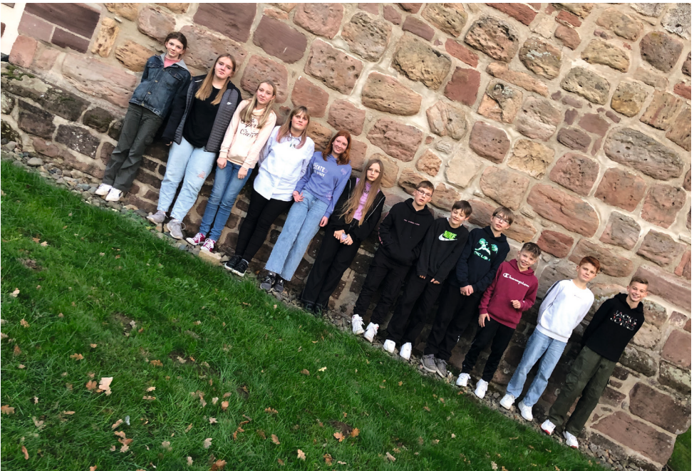
Die Konfirmandinnen und Konfirmanden 2024 St. Georg & St. Martin

Der Konfi-Unterricht hat nach den Sommerferien begonnen und findet - mal in Eisdorf, mal in Nienstedt - gemeinsam mit den Jugendlichen aus Nienstedt/Förste statt.