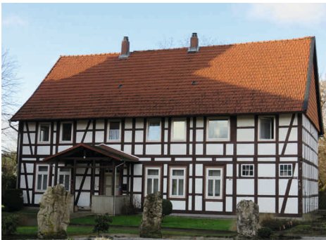
Küsterhaus Eisdorf

ben, der aber vollständig behoben wurde. Dennoch besteht jetzt erheblicher Sanierungsbedarf. Obwohl die Grundsubstanz nach Expertenmeinung sehr gut ist.