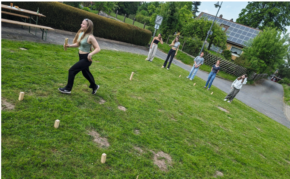
Viel Spaß beim Wikingerschach

Montags ab 18 Uhr bei der St. Martinskirche Nienstedt