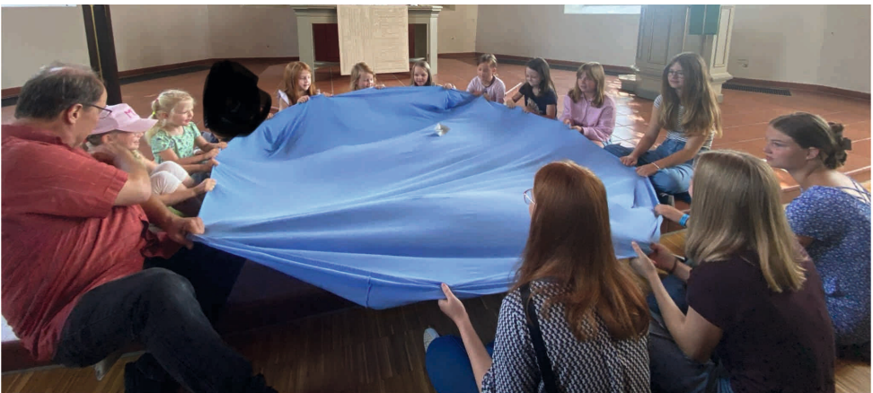
Sturmstillung beim Kindergottesdienst