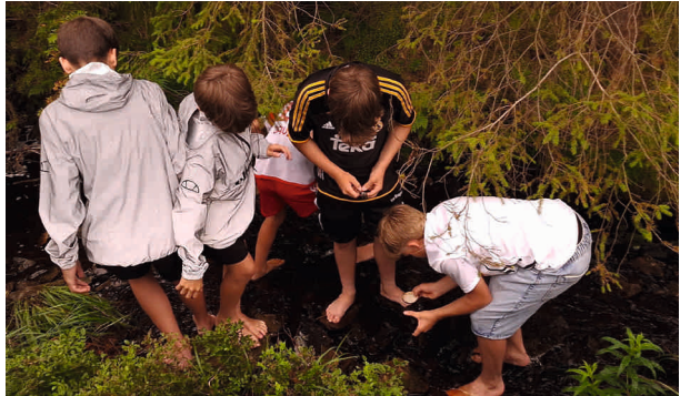
Lebewesen im Wasser entdecken

In der Mitte der Fahrt ging es den ganzen Tag um die Schöpfung. Eine kleine Wanderung rund um das Große Torfhausmoor brachte den Konfis einiges über den Umbruch in der Natur des Oberharzes nahe. Nachmittags wurde es mit Workshops zu unterschiedlichen Umwelt- und Naturthemen ganz praktisch. Zum Beispiel konnten in einem Bach Kleintiere bestimmt werden,