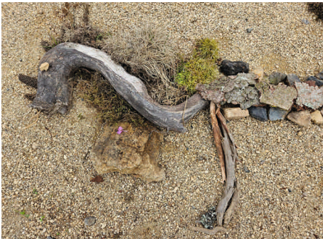
Kunstwerke aus Naturmaterialien

aus denen sich auf die – sehr gute – Wasserqualität schließen ließ.