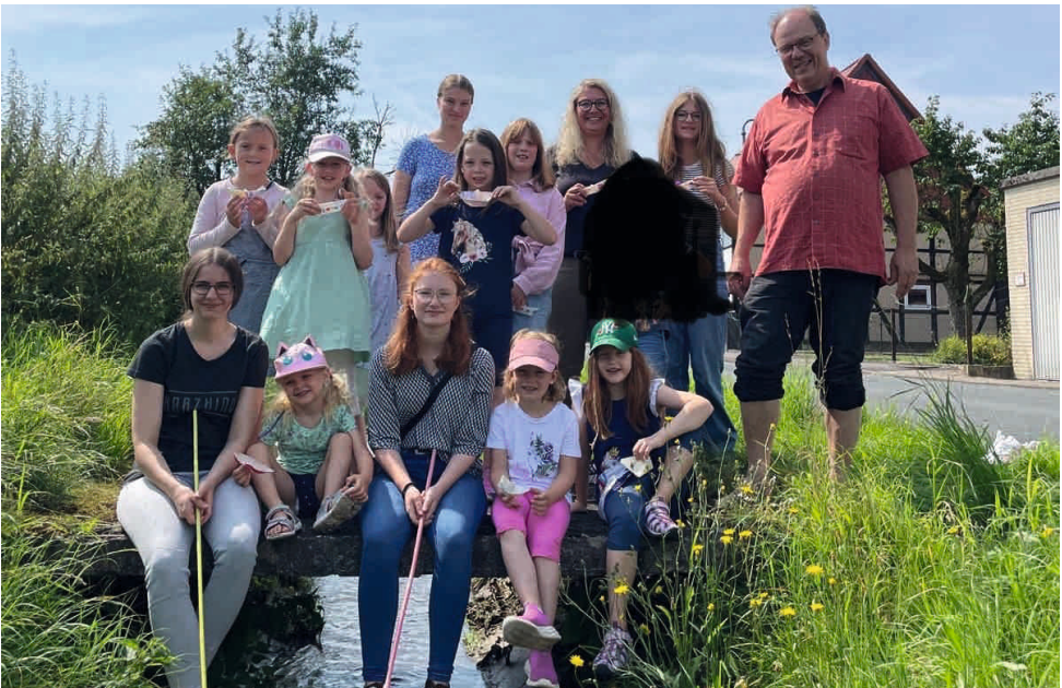
KiGo am Goldbach