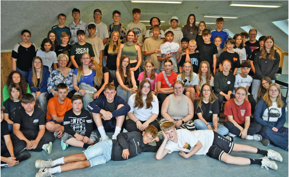
Die gesamte Gruppe

Am Ende der Sommerferien ging es für die Konfirmantinnen und Konfirmanden aus Nienstedt, Förste und Eisdorf für fünf Tage in das Schullandheim Torfhaus im Nationalpark Harz.