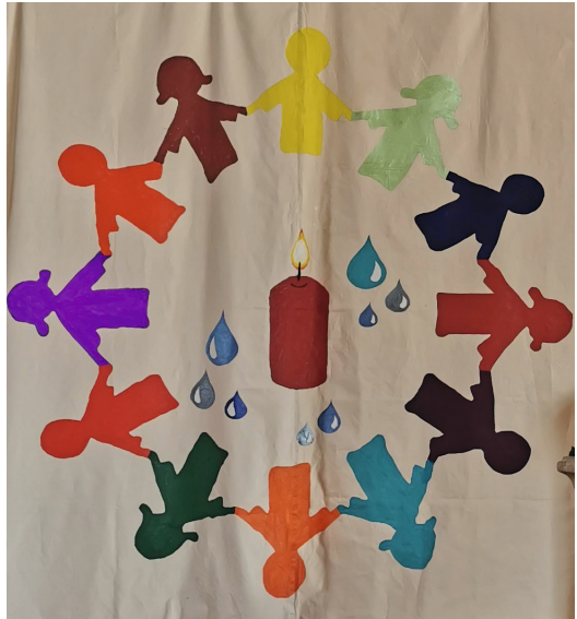
Tauf Tuch St. Martin