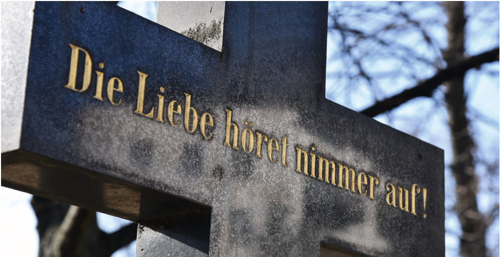
Aus 1. Korinther 13,8

Aber sei nur stille zu Gott, meine Seele; denn er ist meine Hoffnung. Er ist mein Fels, meine Hilfe und mein Schutz, dass ich nicht fallen werde. (Psalm 62,6-7)