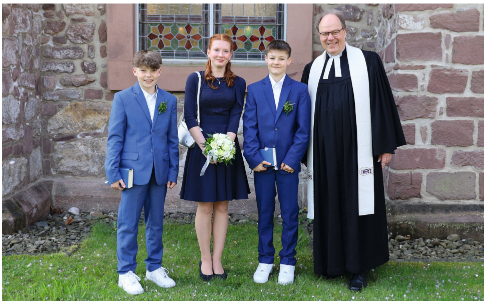
Der Konfirmationsjahrgang 2024 aus Eisdorf-Willensen mit Pastor Rumberg-Schimmelpfeng