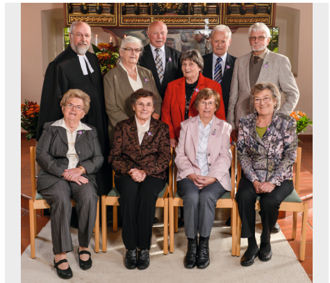
Eiserne Konfirmanden 2013

Die Jubilare werden im Juni 2024 persönlich durch die Kirchengemeinden angeschrieben.