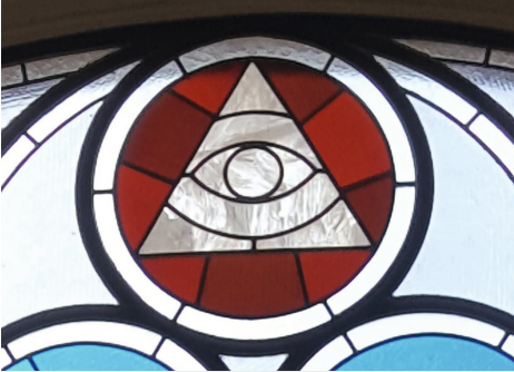
„Auge Gottes im Dreieck“ Symbol für die Dreifaltigkeit Ausschnitt Kirchenfenster Eisdorf

„Heute ist der 7. Sonntag nach Trinitatis!“